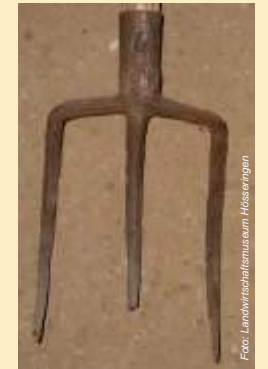
Zum Ausgraben nutzten die Bauern eigens Mergelforken mit besonders stabilen Zinken.

Doch das Mergeln war nicht unumstritten. Zwar erzielten viele Bauern "denkbar beste Ergebnisse", wie 1787 ein Pastor aus Rosche schrieb. Wer jedoch nicht regelmäßig für Humuszufuhr sorgte, z.B. durch Stallmist, dessen Boden war irgendwann "ausgemergelt" und auf Jahrzehnte hin unbrauchbar. Denn Mergel enthält vor allem Kalk, aber keine Nitrate oder Phosphate. So sagten manche, der Mergel mache Väter reich und Kinder arm. Kein Wunder, dass der Bedarf zu Beginn des 20. Jahrhunderts zurück ging, als es bessere und billigere Düngemittel gab wie Guano, Chilesalpeter und vor allem Kali.