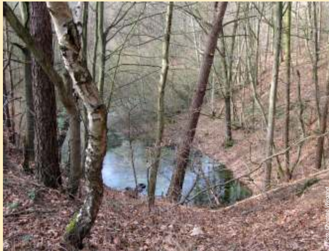
In 12 m Tiefe stieß man in Westerweyhe auf eine Hauptwasserader. Das Wasser trat so schnell aus, dass die Arbeiter nur das Handwerkzeug retten konnten – Loren und Gleise gingen verloren.

Im Wald bei Westerweyhe sind links und rechts des Weges riesige Löcher und Vertiefungen zu sehen. Es handelt sich hier um Mergelkuhlen, die vom Beginn des 19. Jahrhunderts bis etwa 1920 angelegt wurden. Mergel ist ein