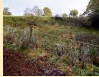
Die Natur erobert diese Mergelkuhle bei Natendorf zurück.

grauweißes, manchmal auch blau oder gelb schimmerndes Sedimentgestein. Es besteht etwa zu gleichen Teilen aus Ton und Kalk, bei höheren Kalkgehalten spricht man von Kalk-, bei niedrigeren von Tonmergel.