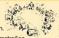
Abb.: Melbayer (2007)